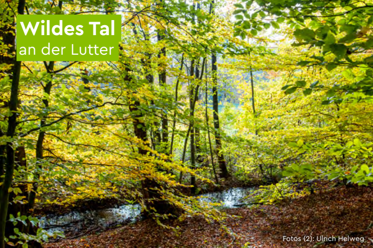
Wildes Tal an der Lutter