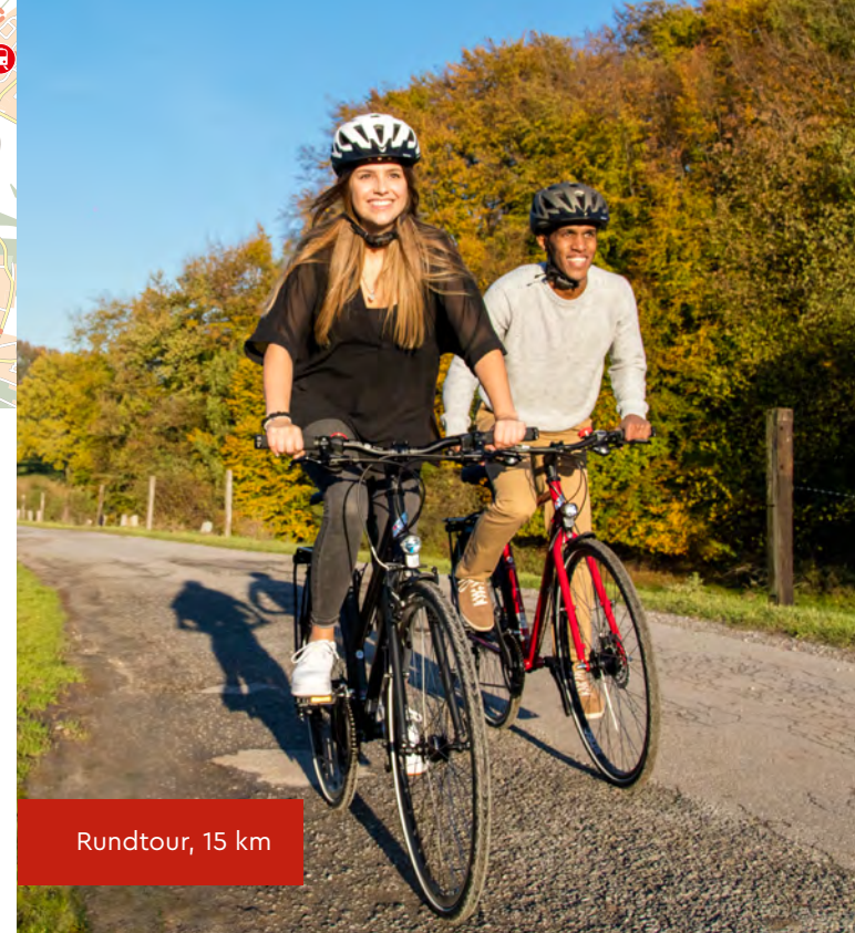
Rundtour, 15 km

Das Knotenpunkt-Netz In ganz Bielefeld sind die Radroutenkreuzungen – die Knotenpunkte – mit Nummern beschildert. Im Knotenpunkt-Netz sind Radtouren ohne große Vorbereitung möglich. Radeln Sie einfach von Knotenpunkt zu Knotenpunkt!