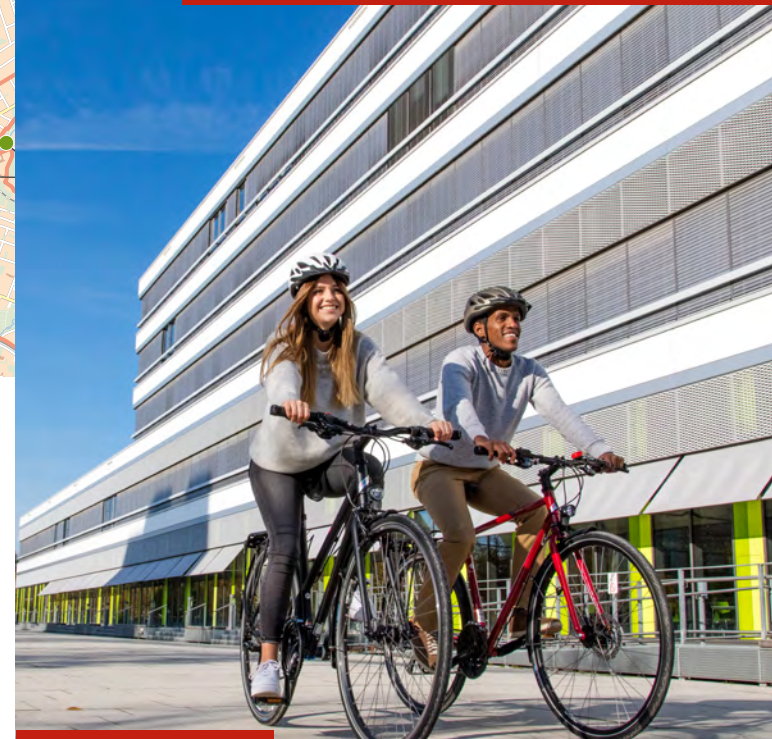
Rundtour, 18 km