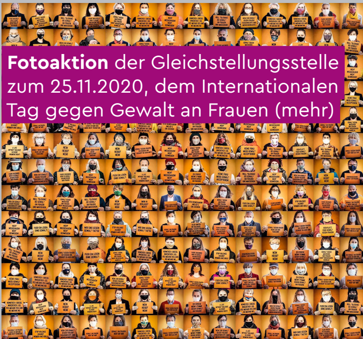
Fotoaktion der Gleichstellungsstelle zum 25.11.2020, dem Internationalen Tag gegen Gewalt an Frauen (mehr)

„Ich freue mich sehr auf meine neuen Aufgaben und die Zusammenarbeit mit internen und externen Kooperationspartner*innen.“