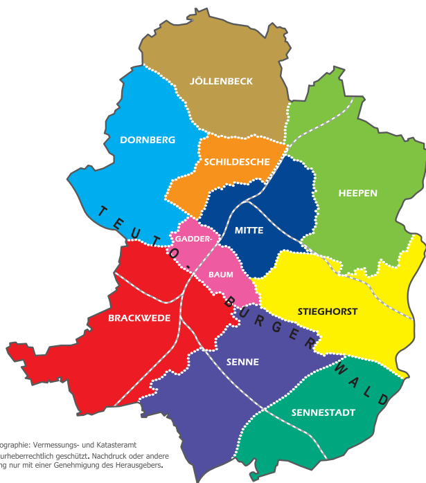
Kartographie: Vermessungs- und Katasteramt Diese Karte ist urheberrechtlich geschützt. Nachdruck oder andere Vervielfältigung nur mit einer Genehmigung des Herausgebers.